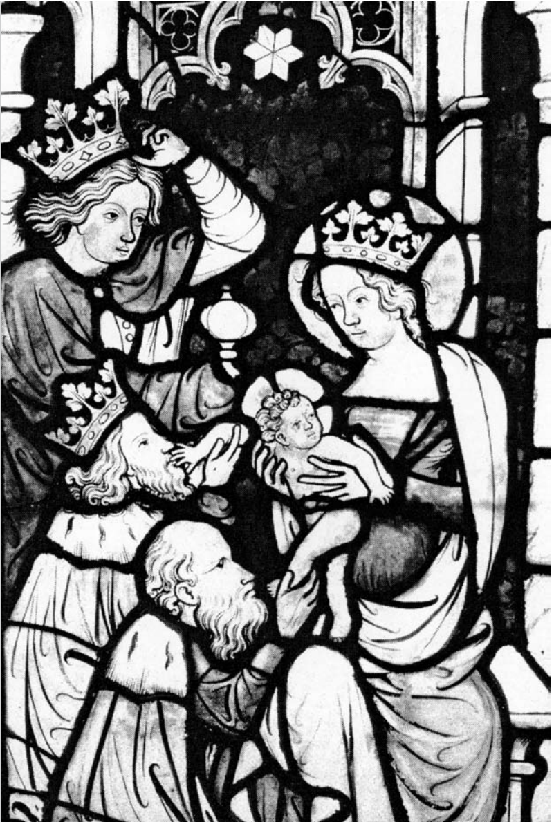
Anbetung der Könige, Glasfenster Stift Viktring